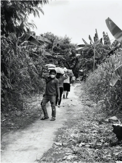
Larawan 1. Pagbubuhat ng mga bigas patungo sa komunidad