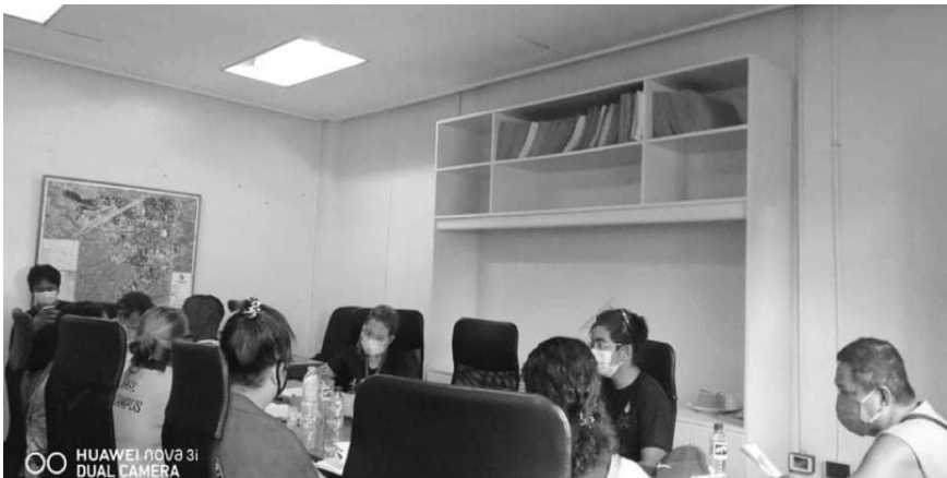
Larawan 3. Advocacy work: Pulong ng mga tsuper, manininda, at mga taga-Pook Malinis sa opisina ng OCR