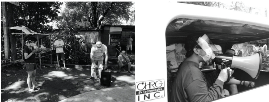
Larawan 5 at 6. Mobile-kumustahan sa komunidad ng UP