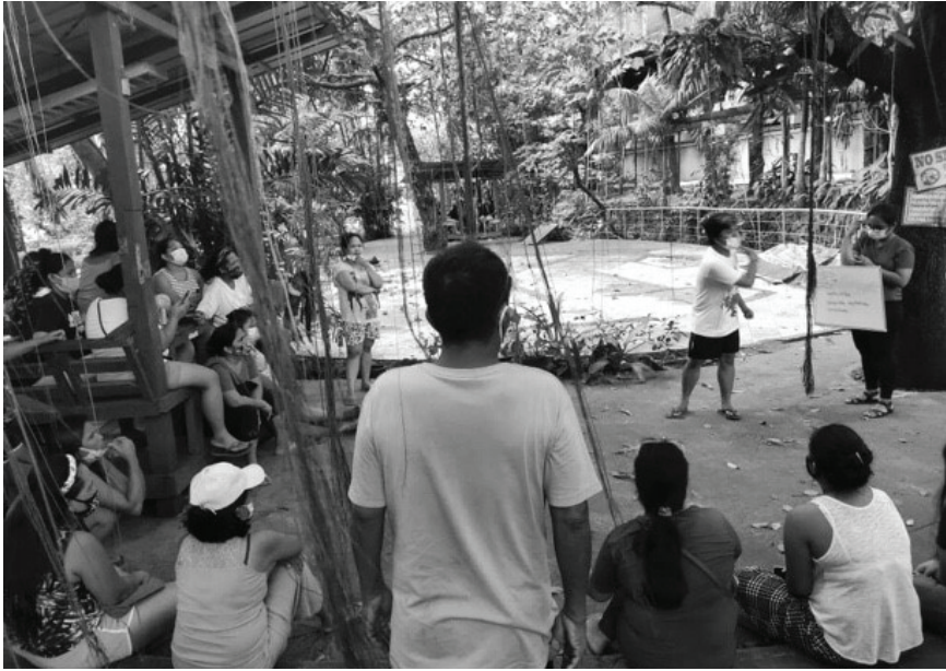
Larawan 4. Pag-aaral ng komunidad Pook Malinis